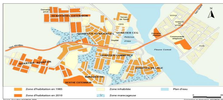
Figure 1 : Dynamisme de l'occupation spatiale à Alépé-ville en 2011

d'un dynamisme urbain dans la commune (Figure 1).