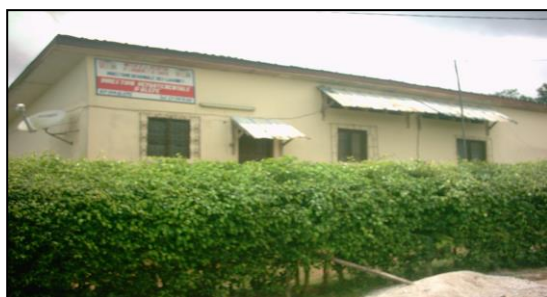
Photo n° 1 : Habitation coloniale réhabilitée. Local du ministère de la construction et de l'urbanisme. Photographie : Adomon, Août, 2009

Ensuite le quartier commerce où les habitats contigus les uns aux autres sont du type évolutif alors qu'au quartier résidentiel et au