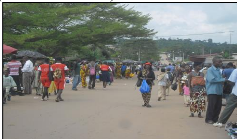
Photo 3 : La voie principale transformée en marché par les commerçants d'étals chaque mercredi à Alépé.

Autrefois centre de commercialisation du café, du cacao, de l'hévéa, du palmier à huile, de la kola, Alépé continue d'être un pôle économiquement prospère où des activités informelles génératrices des ressources additionnelles se développent. Aujourd'hui, avec l'avènement de la Mairie, chaque mercredi, la voie principale est transformée en marché (Photo 3) où se vendent des produits agricoles et des marchandises en provenance d'Abidjan.