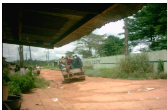
Photo 4 : La route est dans un état de dégradé. Ici un camion benne transporte des passagers d'Alépé à Abrotchi.

Les routes communales sont impraticables. Elles sont dégradées et rendent difficile la liaison entre la ville et les villages. Les camions bennes et les camions « bâchés » restent le moyen adéquat de déplacement (Photo 4).