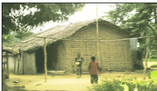
Photo 2 : Habitat traditionnel avec un toit en « papô » Siaka Berthé extension. A côté des enfants s'adonnent à une partie de football. Photographie : Adomon, Août, 2009.

On découvre également dans le paysage urbain des quartiers modernes apparus entre 1980 et 1983. Dans ces quartiers, les constructions sont identiques à celles du quartier résidentiel et C.E.G, à la différence certaines sont inachevées au quartier Château d'eau-SODEFOR et à Siaka-Berthé . A Siaka-Berthé extension , les lots octroyés par la Mairie font encore l'objet de litige entre propriétaires terriens, la Mairie et les acquéreurs depuis 1989. La Mairie n'a pas eu l'autorisation pour lotissement du service du ministère de la construction et de l'urbanisme, il n'existe donc aucun registre ou fichiers fiables pour identifier les lots attribués. Ce qui expliquerait la prolifération d'habitations précaires (Photo 2) dans ce secteur jusqu'à ce jour.